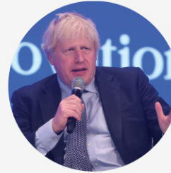
• 보리스 존슨 전 영국 총리