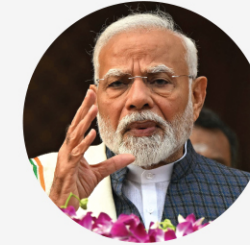
• 나렌드라 모디 인도 총리