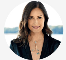
• 산나 마린 전 핀란드 총리