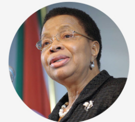
• 그라사 마셀 전 남아공 대통령(넬슨 만델라)의 부인