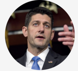
• 폴 라이언 전 미국 연방하원의장