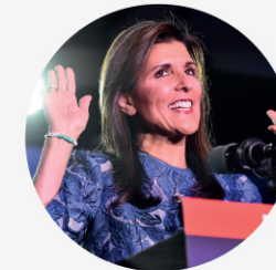
• 니키 헤일리 전 유엔주재 미국 대사