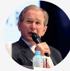
• 조지 W 부시 미국 43대 대통령