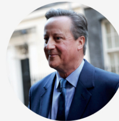
• 데이비드 캐머런 전 영국 총리