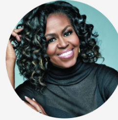
• 미셸 오바마 전 미국 대통령 영부인