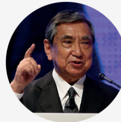
• 고노 요헤이 전 일본 중의원 의장