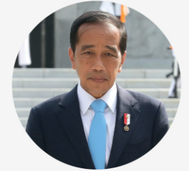
• 조코 위도도 인도네시아 대통령